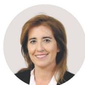
Ana Mendes Godinho Ministra do Trabalho, Solidariedade e Segurança Social

Até à covid-19, o teletrabalho não só era residual, como vinha perdendo relevância, mostram os dados citados pela Confederação Empresarial de Portugal (CIP), em declarações ao Jornal Económico (JE). Ainda assim, no Código do Trabalho, já estava previsto que em teletrabalho, salvo acordo escrito em contrário, o empregador tinha de assegurar os instrumentos e as respectivas despesas de instalação e manutenção.